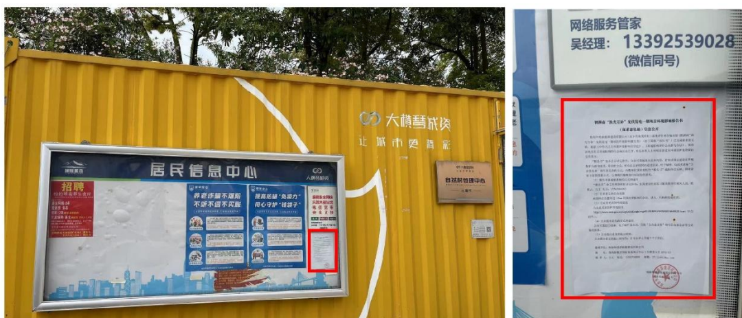
图 3-4 三塘村告示栏公示照片