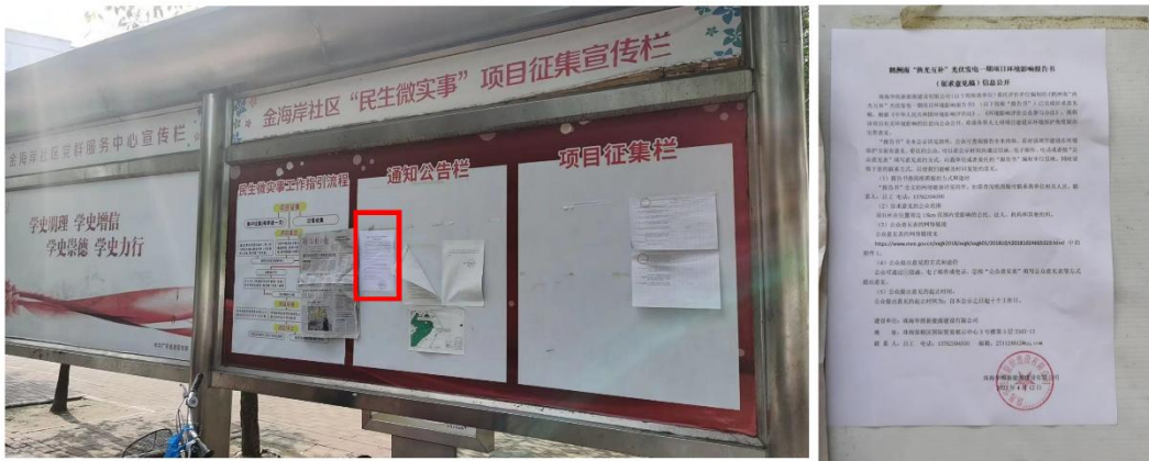
图 3-8 金海岸社区告示栏公示照片

本项目位于广东省珠海市鹤洲新区南垦区，项目在三塘村、下村、三灶社区、三灶镇鱼月村、金海岸社区公告栏均张贴了公示信息。张贴位置属于建设项目所在地公众易于知悉的场所，张贴公示时限共计 10 个工作日，符合《环境影响评价公众参与办法》要求。