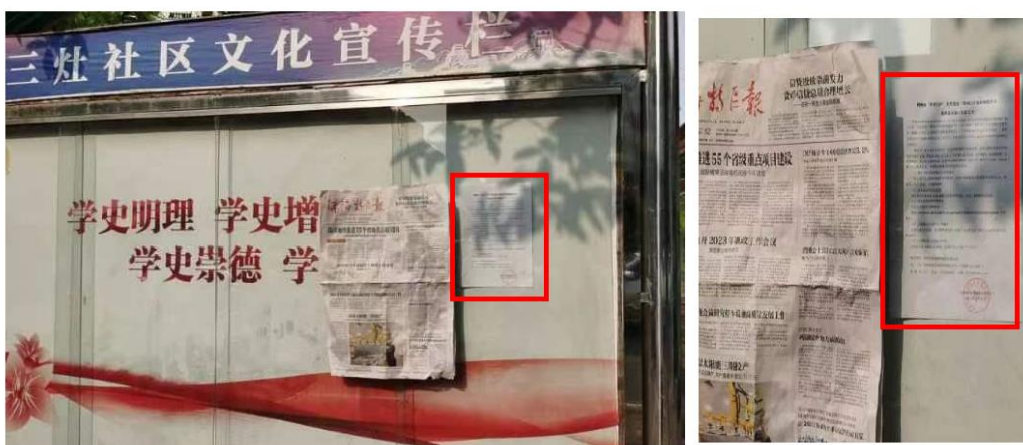
图 3-6 三灶社区告示栏公示照片