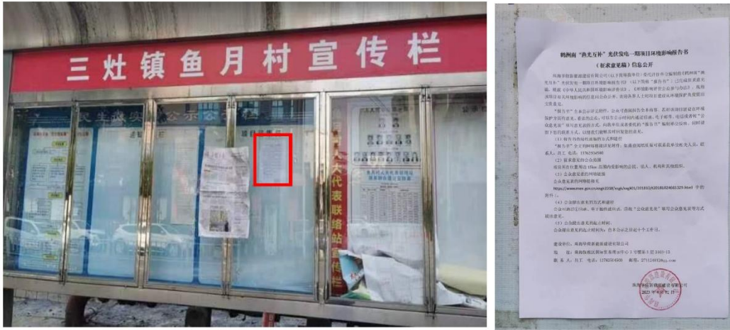
图 3-7 三灶镇鱼月村告示栏公示照片