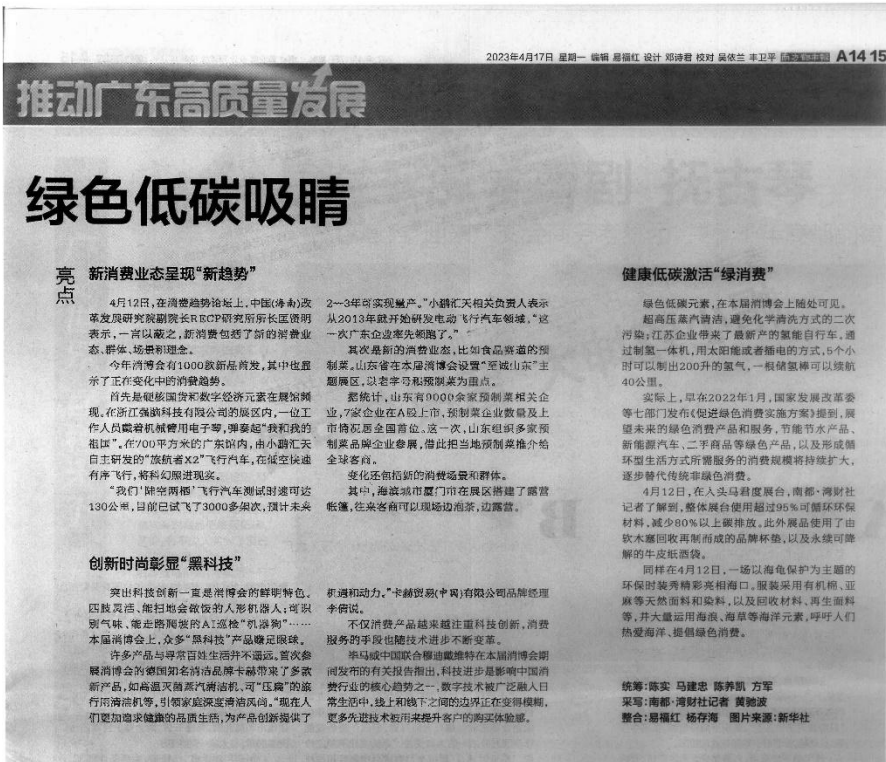
图 3-2 2023 年 4 月 17 日南方都市报信息公示

接触的报纸。本项目在征求意见的10个工作日内共在报纸公开了2次，符合《环境影响评价公众参与办法》的要求。